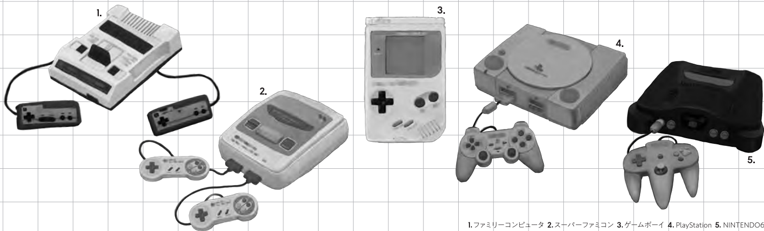
1.ファミリーコンピュータ 2.スーパーファミコン 3.ゲームボーイ 4.PlayStation 5.NINTENDO64